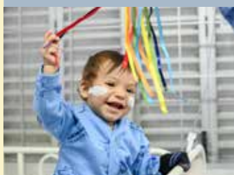
Atividades de recreação