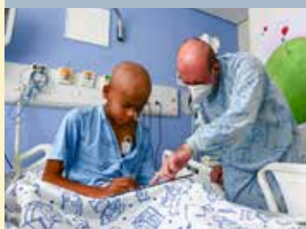
Atividades de acompanhamento escolar