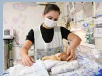
Programa Família Participante